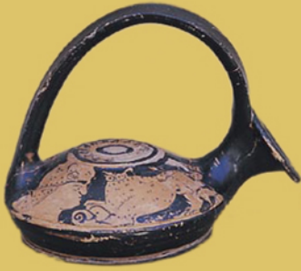
Πύργοι. Ερυθρόμορφος ασκός των μέσων του 4 ου αι. π.Χ.