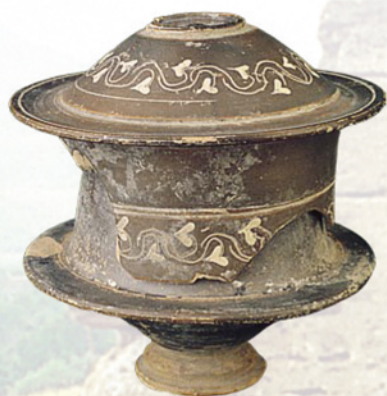
Σπηλιά. Πήλινη ποξίδα, α' μισό 2 ο αι. π.Χ.