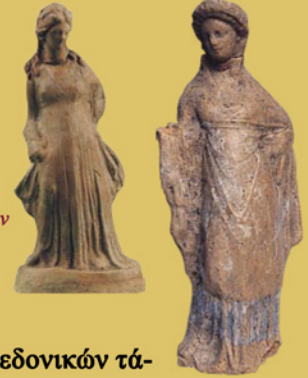
Σηλιά. Ειδώλια γυναικείων μορφών.

Η αποκάλυψη και συστηματική έρευνα των μακεδονικών τάφων στη Σηλιά και τους Πύργους, και παλαιότερα ο εντοπισμός παρόμοιου στις Λικνάδες Βοΐου, επιβεβαιώνει την κοινή ταυτότητα ταφικών εθίμων και πρακτικών μεταξύ Κάτω και Άνω Μακεδονίας, ανατρέποντας μ' αυτό τον τρόπο την πεποίθηση περί πολιτιστικής και κοινωνικής απομόνωσης της δευτέρης. Επιπλέον, προσθέτει δύο ακόμα δείγματα στην ποικιλία της αρχιτεκτονικής μορφής, που παρουσιάζει το είδος των μνημείων αυτών. Τέλος, αναπτρώνει την ελπίδα ότι η συστηματική αρχαιολογική έρευνα που άρχισε τα τελευταία χρόνια στη Δυτική Μακεδονία θα φέρει στο φως και άλλα, ίσως λαμπρότερα, δείγματα του πολιτισμού των κατοίκων της περιοχής.