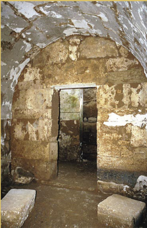
Σηλιά. Εσωτερικό του τάφου.