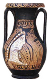
Πύργοι. Ερυθρόμορφη πελίκη, τέλη 4 ου αι. π.Χ.

Τα ευρήματα του τάφου τον χρονολογούν σε μια πρόωμη σχετικά εποχή, δηλαδή στο τελευταίο τέταρτο του 4 ου αι. π.Χ., κατατάσσοντάς τον στα αρχαιότερα δείγματα του είδους.