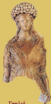
Σπηλιά. Ειδώλιο γυναικείας μορφής.

Τα κτερίσματα του τάφου χρονολογούνται από το β' τέταρτο του 2 ου αι. π.Χ. ως το τελευταίο τέταρτο του 1 ου αι. π.Χ. Η σύγκριση, ωστόσο, με άλλα μνημεία του είδους, μας οδηγεί σε πολύ προαιμότερη ένταξη, στον 4 ο αι. π.Χ. Αν τούτο ισχύει, συμπεραίνουμε ότι ο τάφος καθαρίστηκε από τις πρώιμες ταφές και παρέμειναν σ' αυτόν οι οψιμότερες.