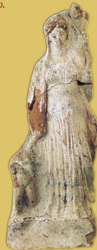
Σηλιά. Ειδώλιο Αφροδίτης.